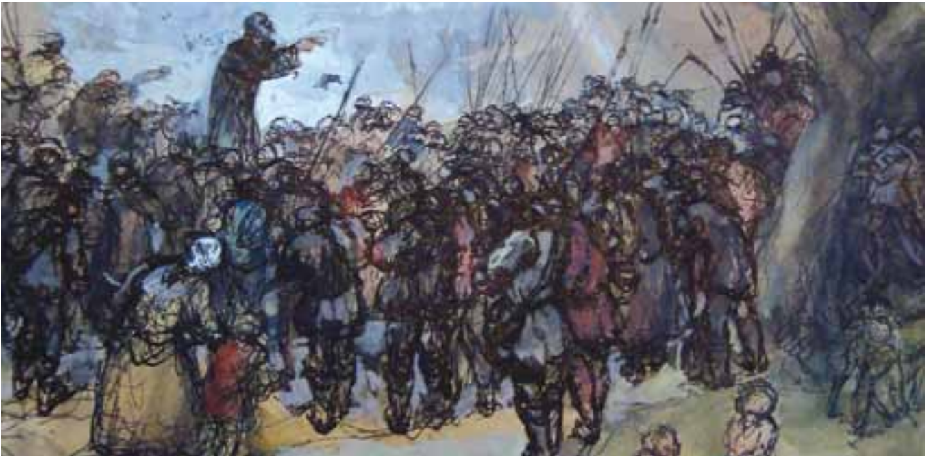
Müntzer predigend, Bernd Grothe 1953

Am 31. Oktober 1517 veröffentlichte Martin Luther 95 Thesen gegen den Missbrauch des Ablasses. Der berühmte Thesenanschlag Luthers gilt als Beginn der Reformation. Diese Tat löste eine Bewegung aus, welche die Menschen nicht nur in Deutschland, sondern auch in Europa und Amerika nachhaltig beeinflusste und weltweit Spuren hinterließ. Die Reformation prägte neben Kirche und Theologie auch Musik und Kunst, Wirtschaft und Soziales, Sprache und Recht. Kaum ein Lebensbereich blieb von der Reformation unberührt. Am 31. Oktober 2017 jährt sich der Thesenanschlag zum 500. Mal.