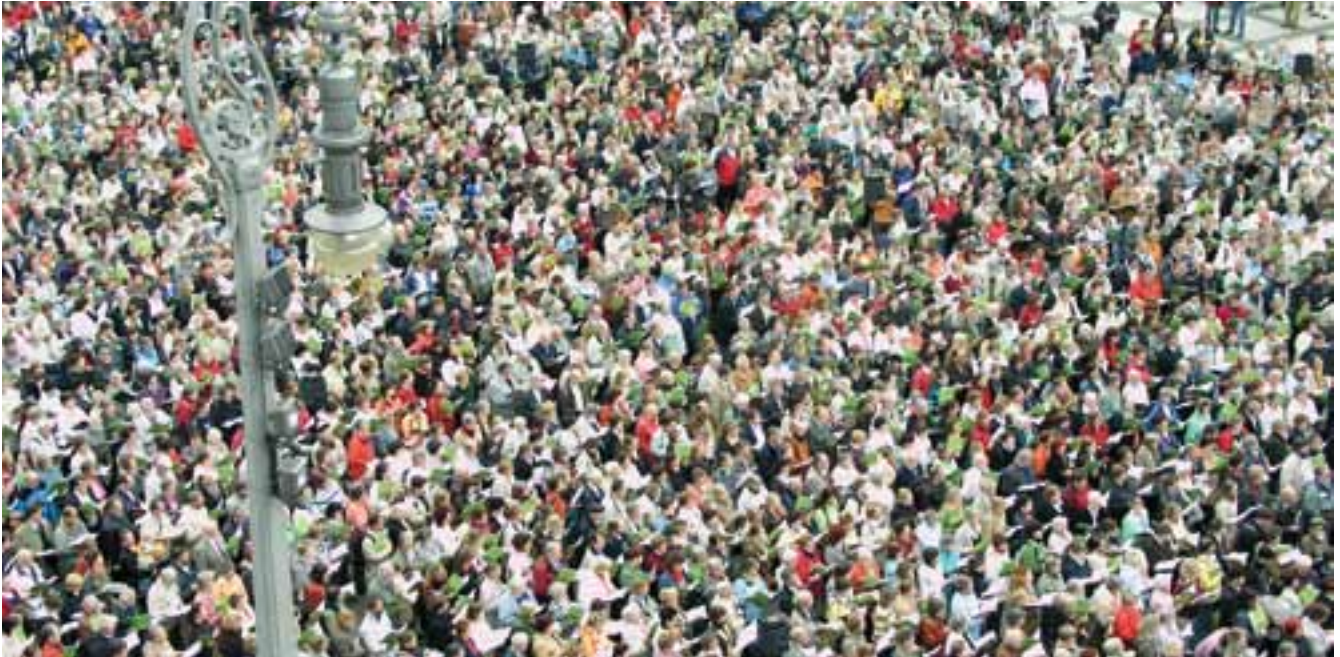
Landeskirchentag Sachsen & Evangelisches Chorfest „Hier stehe ich“

Sie interessieren sich für Reformation und Politik? Auch wenn sich die Verbindung von Reformation und Politik nicht auf den ersten Blick erschließt. Hier werden Sie erfahren: Die Reformation hat von Beginn an politisch gewirkt und die politisch Mächtigen haben den Verlauf der Reformation beeinflusst.